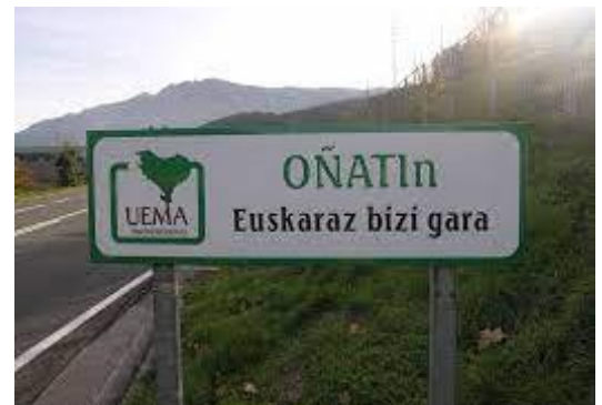
VIDEO EL EUSKERA EN OÑATI