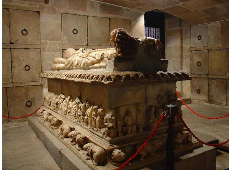
BIDEOA TURISMOA OÑATIN