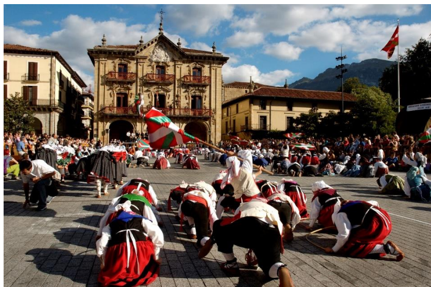
BIDEOA OÑATI ALDERIK ALDE