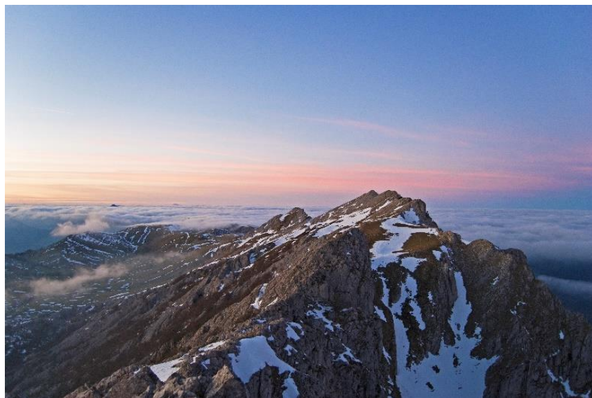
BIDEOA NATURA OÑATIN